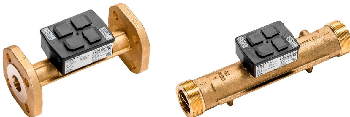
Рисунок 1 – Общий вид

Схема пломбировки от несанкционированного доступа, обозначение места нанесения знака поверки представлены на рисунке 2.