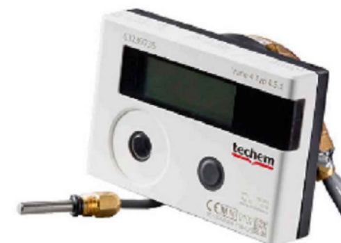
теплосчетчик Comrad vario4